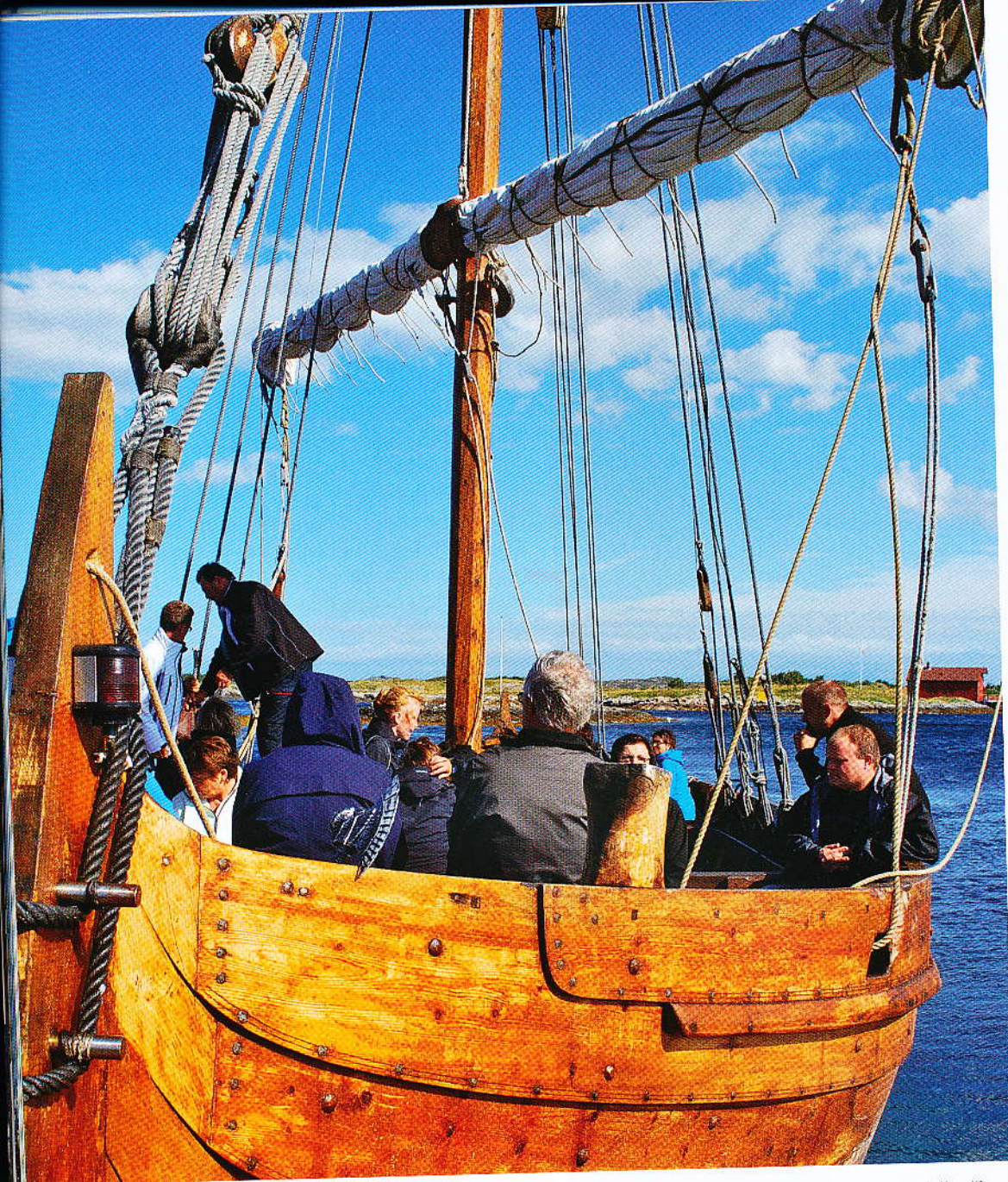
▼ Na plavbu po zátocce Hustadvika vyrážejí turisté v replice vikinského člunu

restauraci, bar i příjemné posezení pro pár lidí v rekonstruované pekárně. Typické norské dřevěné, většinou červeně natřené domky seskupené kolem malého přístaviště vytvářejí idylickou atmosféru. U přístavního mola kotví vikinský člun Kvitserk, jenž je replikou Saga Siglar. Hosté Håholmen Havstuer, ale i návštěvníci ostrova, se na lodi vydávají na výletní plavby po zátocce Hustadvika. Pobyt jim také zpestřují výlety na rychlém člunu, rybolov a procházky po ostrově.